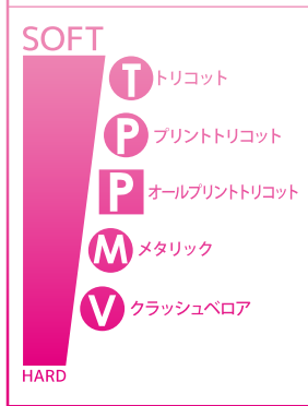
レオタード生地別着心地比較表

ボディーサイズレオタード対応表は、身長だけでなく、バスト・ヒップ・ガースも参考にサイズをお選び下さい。成長を見越してワンサイズ上のレオタードをご検討される場合、袖・襟の太さや袖丈等も一周り大きくなります。それにより、背中周りや袖にしわが生じる場合がございます。